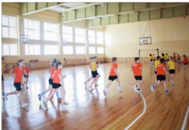
Большой спортивный зал