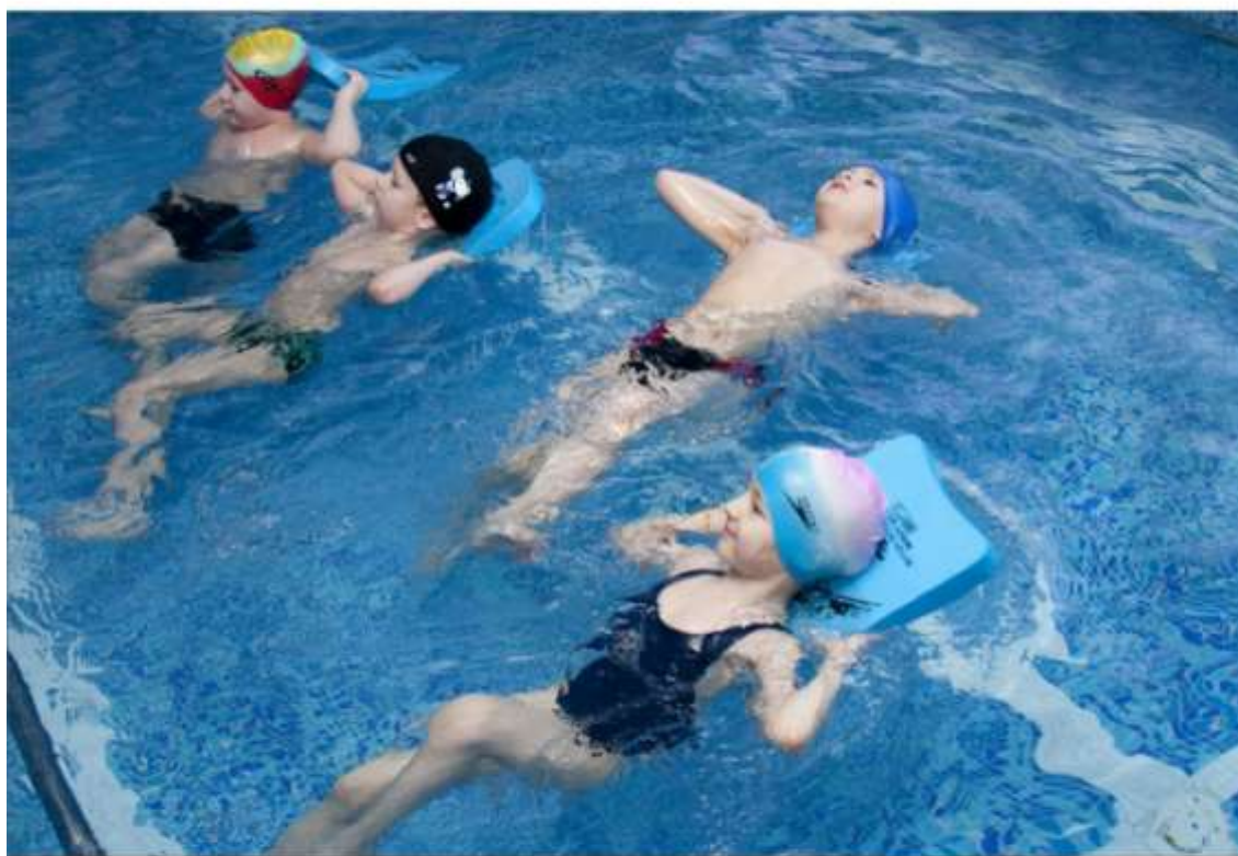
Бассейн в подразделении дошкольного образования