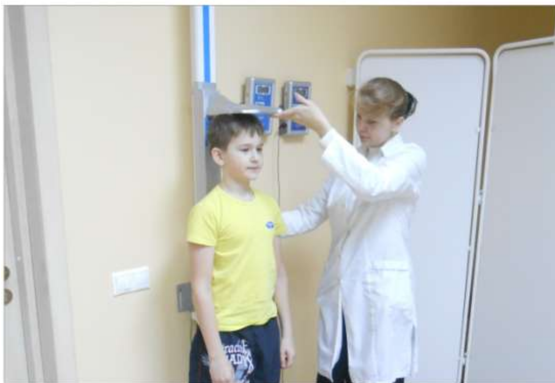
Оценка физического развития