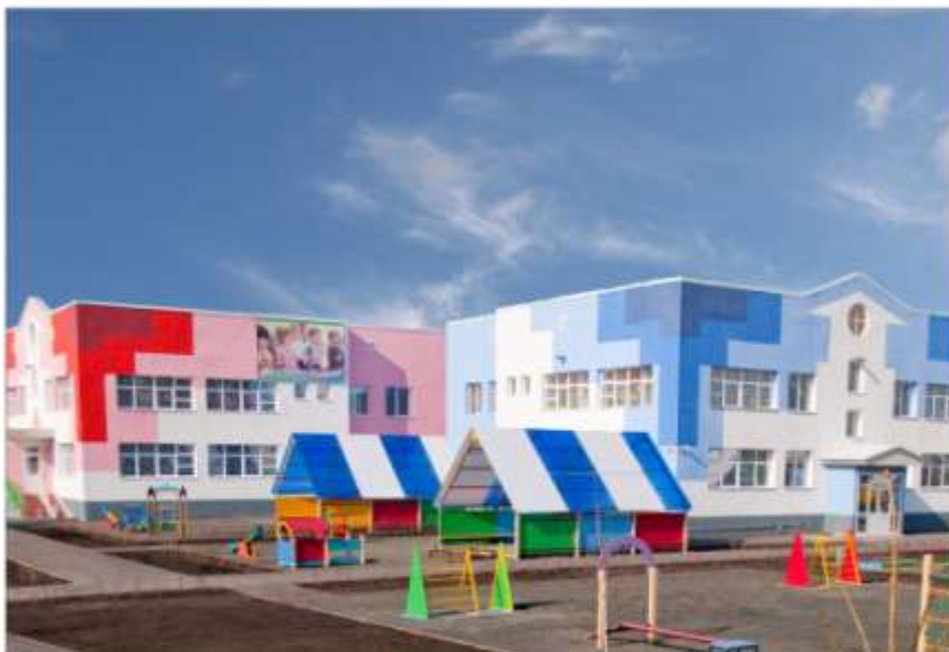
Подразделение дошкольного образования детей