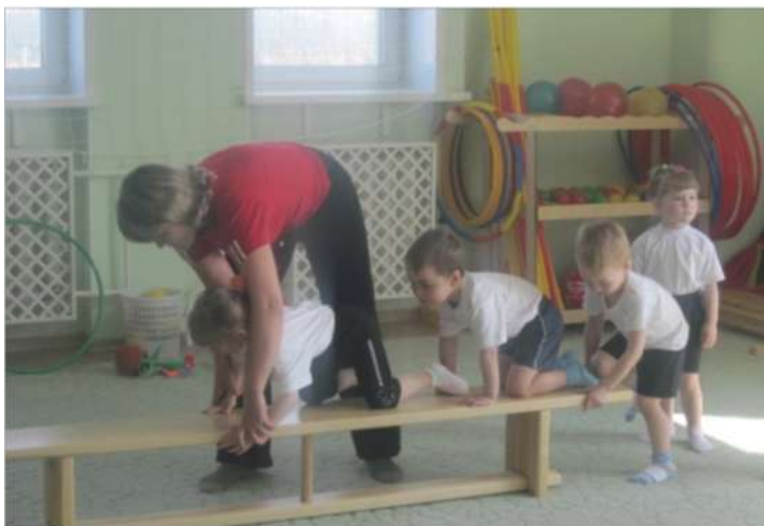
Физкультурное занятие в подразделении дошкольного образования