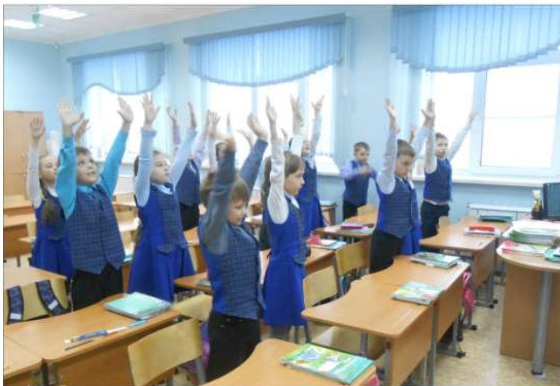
Физминутка в начальной школе