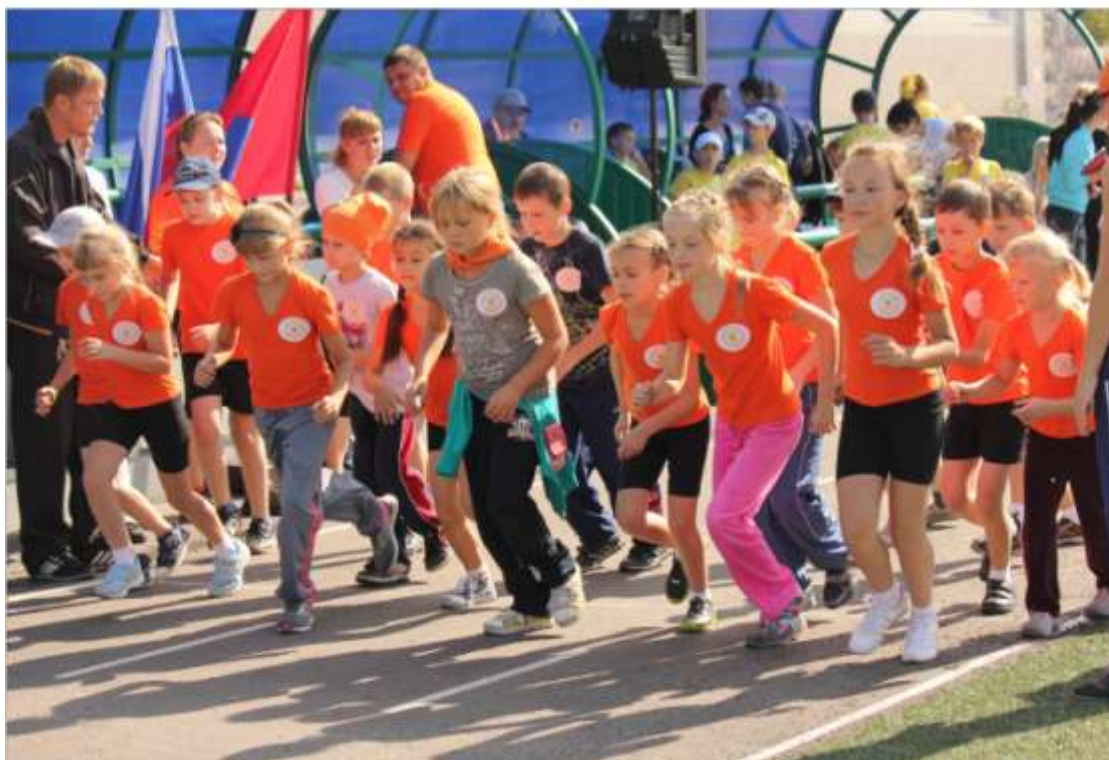
Сдача норм ГТЗО