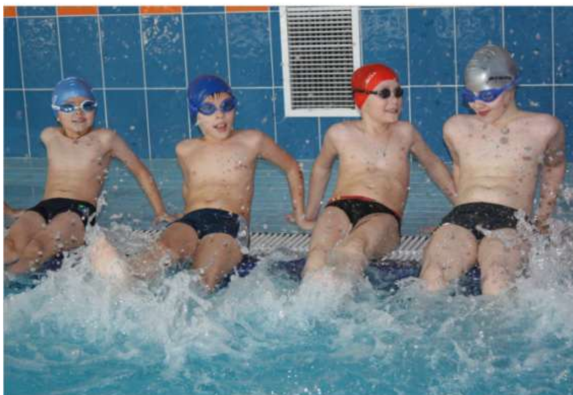
Бассейн в гимназии