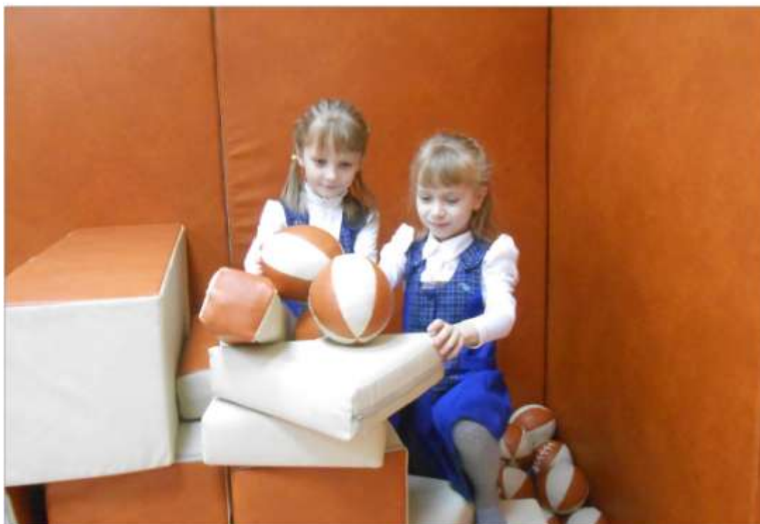
Кабинет психологической разгрузки