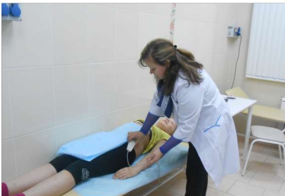
Оценка функционального состояния и адаптации