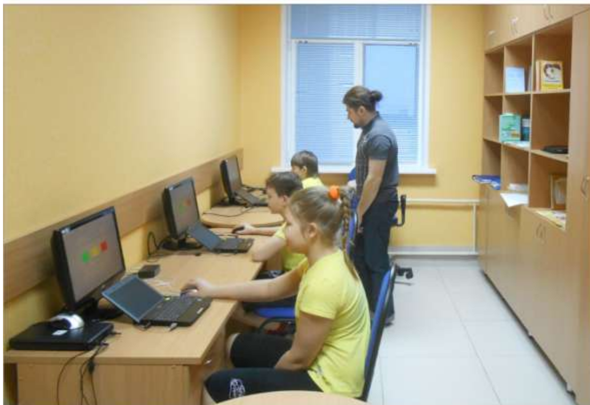
Кабинет функциональной диагностики