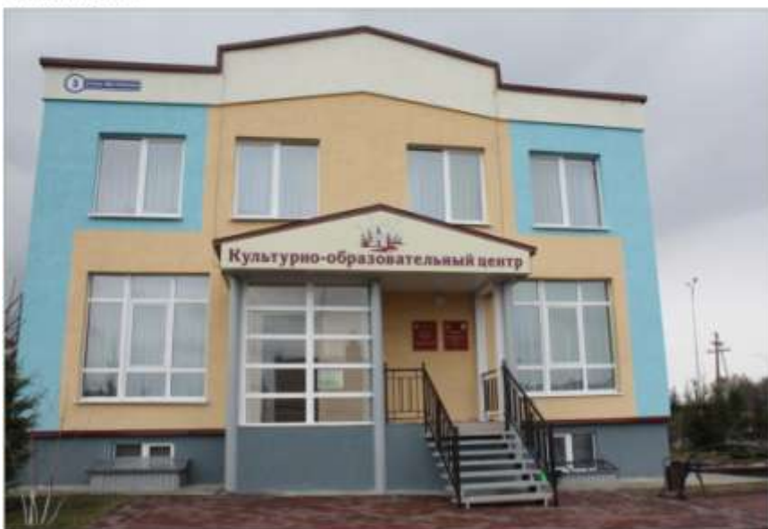
Подразделение дополнительного образования детей