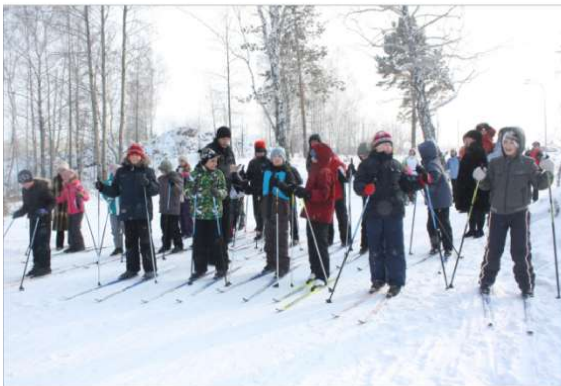
Сдача норм ГТЗО - лыжи